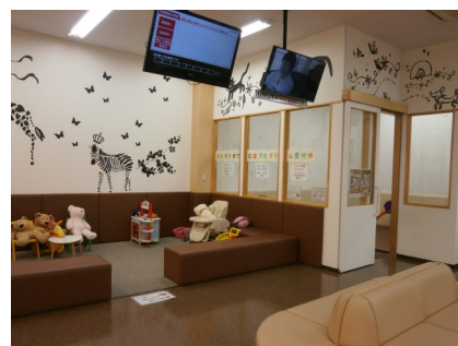
写真：設置されたウォーターネットとスタッフさん。(右上) 2部屋あるキッズスペース。仕切られているので、お子さんの声の心配もなし！(下)

インタビューでも便利だと話にあったウォーターネットの水。当社にてレンタル・宅配・メンテナンスの全てを行っております。ぜひ一度お試しください。