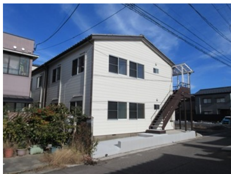
新潟市中央区下所島アパート外観

なお、今なら102号室をモデルルームとして公開中です。モデルルームをご覧いただければ、お住まい後の新生活のイメージも湧きますので、ご覧になりたい方はお気軽にお問い合わせください！