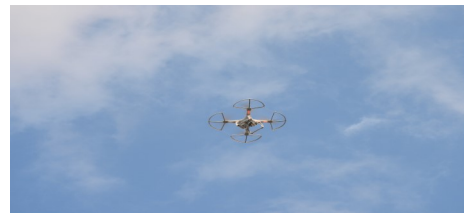
写真上:撮影者(ドローン操縦者)保科和美 写真下:千代田号(昨年10月実演フライト時)