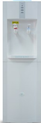
ウォーターサーバー-L 2.0