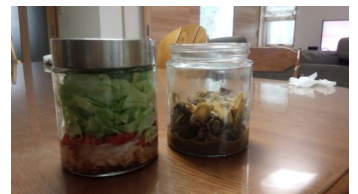
「ジャーサラダ」はつくりおきできるのが魅力ですね！うちもまとめてつくります。

皆さん「ジャーサラダ」をご存じですか？ もともとはアメリカの缶の会社の密封できるフタのついたガラス容器にサラダを入れたことが始まりだそうで、最近日本でもボトルサラダなどとして知られてきましたね。流行りに便乗した私、つくってみました！（料理は苦手ですが…サラダくらいなら作れるかな、と思い）つくってみて気が付いたのですが、これがけっこう理にかなっているのです！下にドレッシング、固い野菜で味をしみこませる。上に葉物野菜をぎゅうぎゅうにつめて真空に近い状態にする…日持ちするテクニックが組み込まれていることに感心しました！きちんとつくると冷蔵庫で5日も日持ちするとか！ 皆さんも健康づくりのためにつくってみてはいかがでしょうか？ （編集者 馬場真理子）