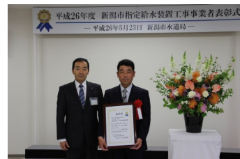
写真上：5月23日表彰式の様子

今回の表彰を社員一同、大変に喜んでおります。「優良工事店」の名に恥じぬよう、今後も努力を怠らず、日々精進してまいりたいと思っております。宜しく願いいたします。