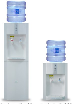
ウォーターサーバーL 2.0 ウォーターサーバーS 2.0

特集のインタビューでも好評だった【ウォーターネット】の水。 当社にてレンタル・宅配・メンテナンスの全てを行っております。ぜひ一度お試しください。