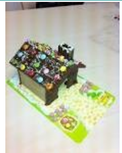
某お菓子メーカーから出ているチョコレートでつくるお菓子の家、に興味を持っています。一度つくってみたいと思いつつ、なかなか手が出ません(笑)

今流行ってるインフルエンザもかからないように、娘には「外から帰ってきたらうがいでよ〜」と呪文のように念じているところです。（編集者 馬場真理子）