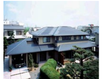
建築デザインにマッチさせた 屋根建材型のソーラーシステム

今回は、その太陽光システムの『 買取システム 』について、くわしくお話ししたいと思います。