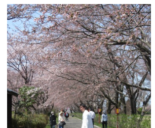
今年の桜は満開になるのも遅かったですが、散るのも早かったような気がします。それでも毎年、やっぱり楽しみです。

先日、私が風邪をひき咳が止まらなくなってしまい、サーバーから水を出そうと慌てていると、水の入ったコップが私のもとに。笑顔で「はい」と渡してくれる娘。どうやら得意気になって私に水をくれる様子。いつもなら、「勝手に出しちゃダメ」怒るところなのですが、思わず娘の行動に怒ることもできず…。それ以来、毎日、私のところにサーバーから水を並々と注いだ娘が現れます。難点はその水がだいぶ減ってくるところですが。 （編集者 馬場真理子）