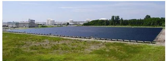
東区にある「新潟雪国型メガソーラー発電所」

実際、新潟県では平成22年8月31日に「新潟版グリーンニューディール政策」の一環として「新潟雪国型メガソーラー発電所」の運営が開始されています。太陽電池による商業発電施設では日本初です。発電した電力は全量東北電力に売電され、近隣地域で使用する電力の一部になっています。