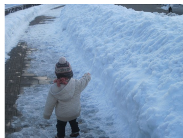
子供ってどうしてあんなに雪が好きなのでしょうか……。走り回る娘に日々困り果てている母です。