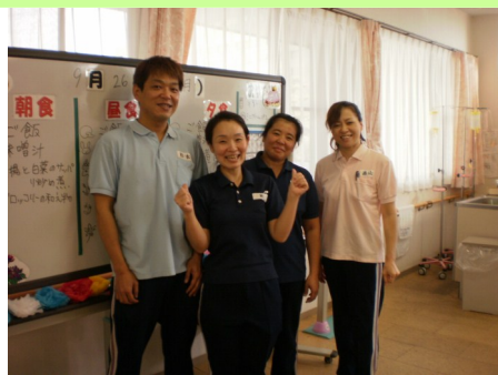
(写真 上) 明るく元気なスタッフの皆さん