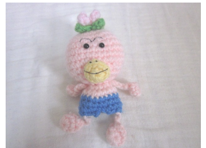
知っている人は知っている、あの人気者のカッパのキャラクターです! とても手編みとは思えない仕上がりのです!

先日、娘にと手編みのぬいぐるみを頂きました。すごく上手な仕上がりにびっくり! 作成した彼女は現在育児の真っ最中。ですが、私は彼女がバリバリ働いていた姿をよく知っているの、正直、彼女の意外な姿に驚きでした。でも、こういう意外な特技や趣味を持っているというのは素敵なことですよ! 私もこの秋に何か始めようかな・・・なんて考えているところです。でも考えているうちに冬が来たりして! ? (編集者 馬場真理子)