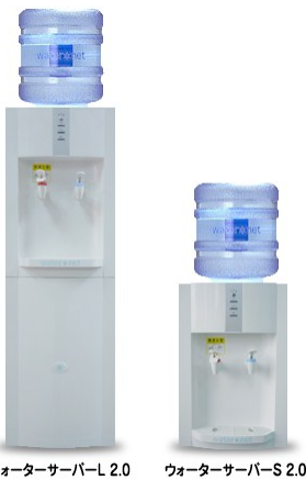
ウォーターサーバーL 2.0 ウォーターサーバーS 2.0