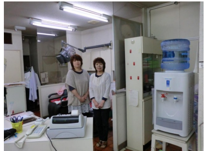
(写真 上) お店の様子 西堀通にあります